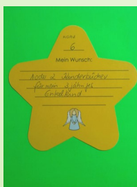
Wunschstern von Gast in Zimmer 6

Wir möchten uns im Namen unserer Gäste und unseres Teams beim Seniorenbeirat, dessen Mitgliedern und den Wunscherfüller*innen herzlich für die Erfüllung der Wünsche unserer Gäste und die schönen Momente der Freude bedanken.