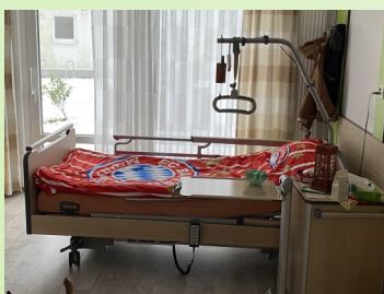
FC Bayern München Bettwäsche sorgt für Gemütlichkeit